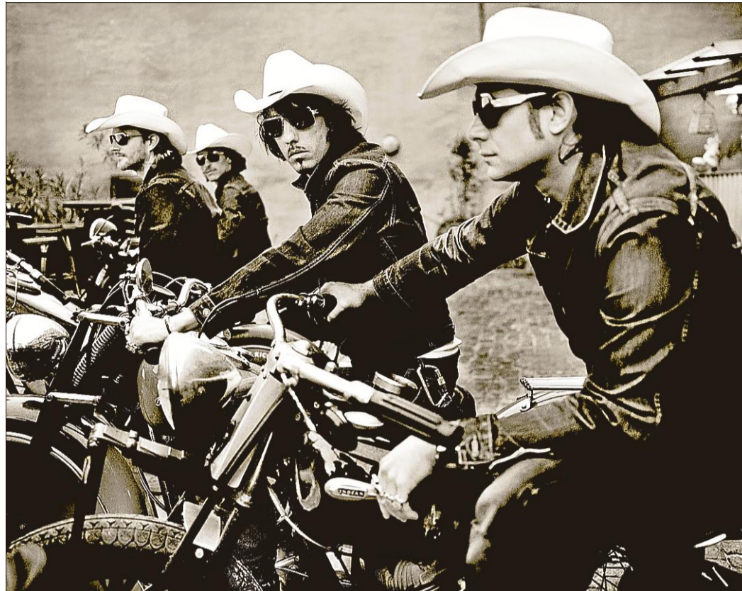
Auch the Bosshoss rocken das Deichbrand-Festival.

Wann? 22. und 23. Juli Wo? Diepholz Wer ist dabei? Beat Beat Beat, Bodi Bill, Bombay Bicycle Club, Hundreds, Johnossi, Who Knew, Tim Neuhaus, Me-