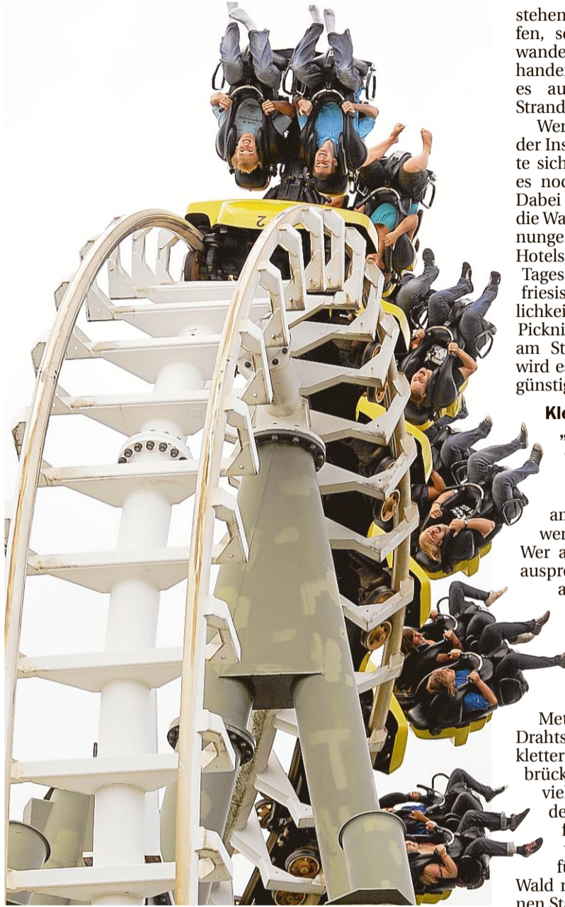
Kopfüber in der Achterbahn „Limit“ im Heidepark Soltau – ein tolles Sommerferienvergnügen.

Ein guter Tipp gegen Langeweile in den Ferien, ist der Aufenthalt auf einer Insel. Warum viel Geld für einen Flug investieren, wenn Inseln wie Wangerooge und Langeoog direkt vor der Tür liegen? Die insgesamt sieben ostfriesischen Inseln laden grade dazu